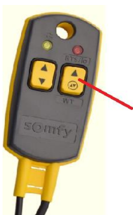
Bouton pour appuyer les deux directions en même temps

Le réglage des positions de fin de course doit être réalisé par un câble de montage équipé d'un bouton particulier qui couple les deux sens en même temps (par exemple, câble de montage Somfy). Après le branchement dans la prise, le témoin de fonctionnement jaune sur le câble Somfy doit s'allumer (s'il ne s'allume pas, il y a un défaut au niveau de la distribution de l'électricité ou du câble de montage).